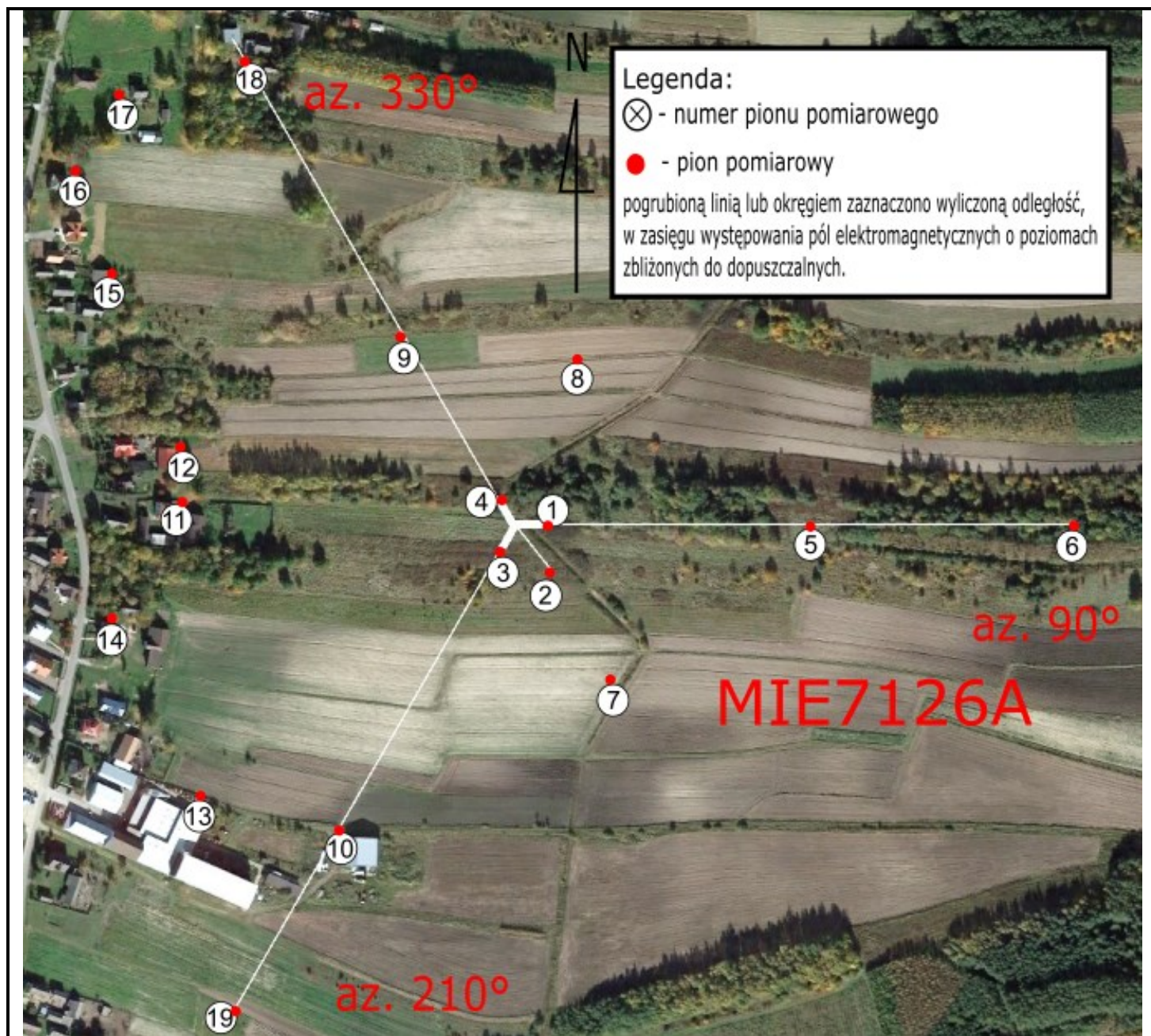
Zdjęcie satelitarne: Image © 2023 Google