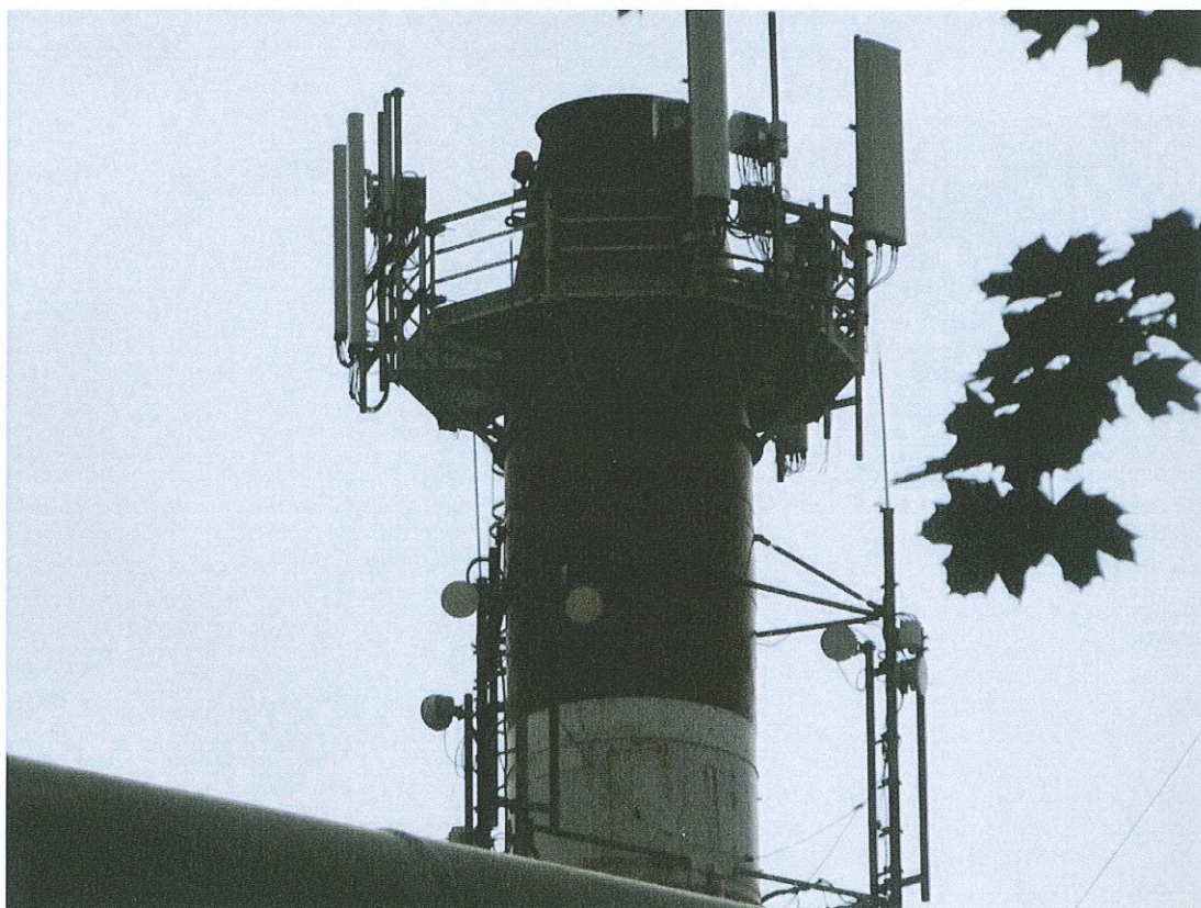
Widok instalacji radiokomunikacyjnej Stacja Netia MIELB017 - MIELM00002ANT003 Mielec, ul. Wojska Polskiego 3.