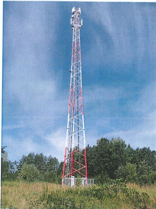
Zał. nr 1: Widok ogólny instalacji radiokomunikacyjnej.

Koniec sprawozdania. Sprawozdanie zawiera dodatkowo załączniki nr 1 i 2.