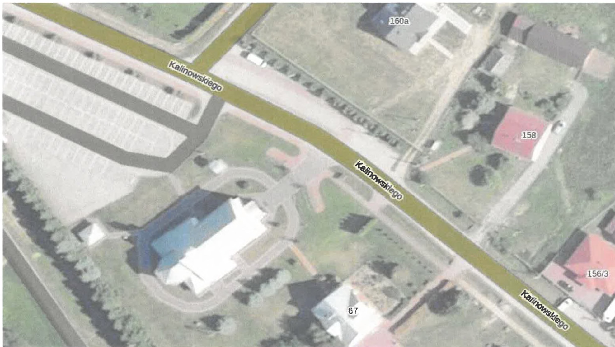
Wniosek o zrekonstruowanie w okolicach kościoła parafialnego przejścia drogowego przez drogę powiatową P 1179R w miejscowości Dulcza Wielka.